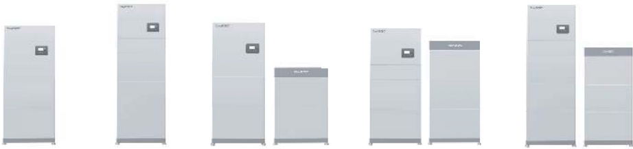
SCHÉMA DU SYSTÈME