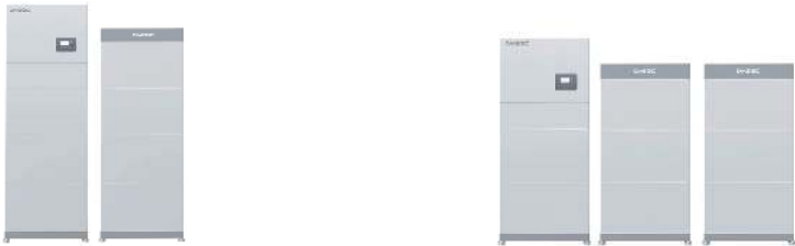
SCHÉMA DU SYSTÈME